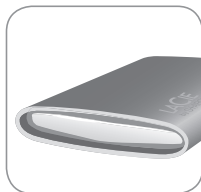
LaCie Starck USB 3.0 Mobile Hard Drive