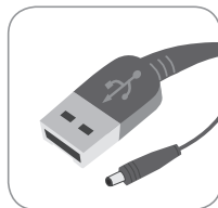
USB Power cable (in select packages only)

Note: LaCie Storage Utilities and user manual are pre-loaded on the drive.