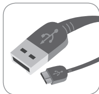
USB 3.0 Cable (USB 2.0-Compatible)